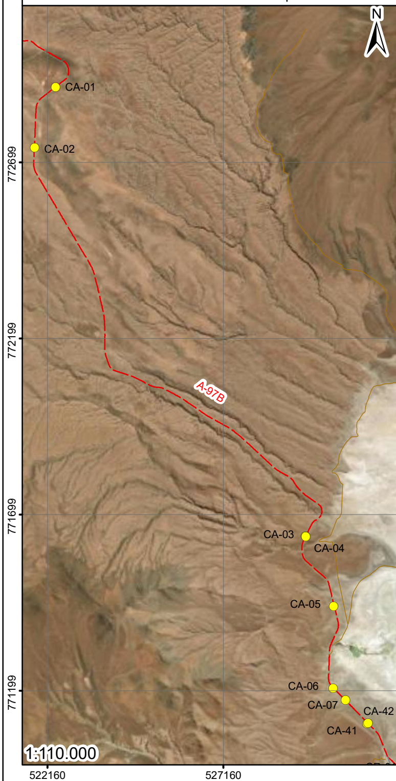
Ruta A97-B sector Jachucoposa